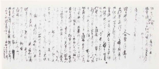
文政12年 徳山騒動に関する書状(4月12日 江戸宛)