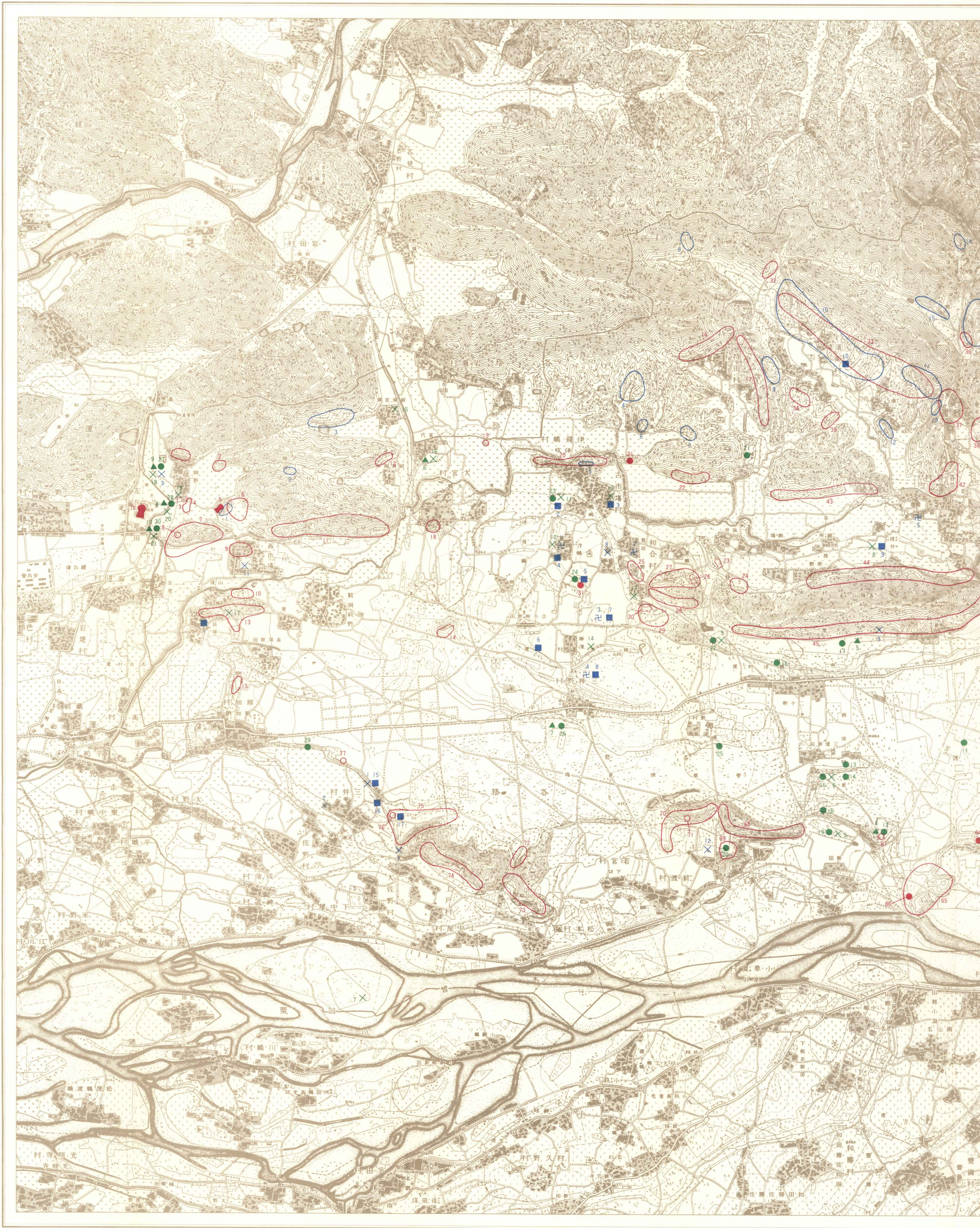
各務原市史 考古 付図1 遺跡分布地図 考古-民俗編