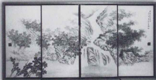
「木曾桃山飛泉」成木星州作 (萬松園 蔵)