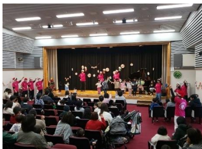
中央図書館(昨年の様子)

岐阜各務野高校の生徒によるハンドベル演奏、 中部学院大学のボランティアサークル(ラ・ルーララボ)の学生による 絵本・パネルシアター・歌・合奏など盛りだくさん☆