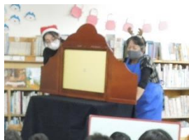
川島ほんの家(昨年の様子)