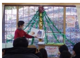
もりの本やさん(昨年の様子)