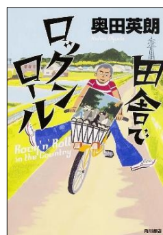
田舎でロックンロール 奥田 英朗/著 KADOKAWA