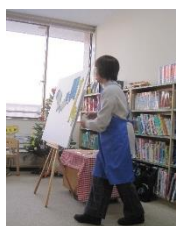
中央ライフデザインセンター図書室(昨年の様子)