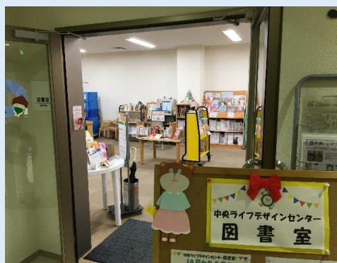
中央ライフデザインセンター図書室