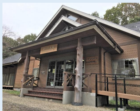
もりの本やさん・森の交流館