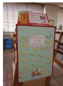
川島ほんの家 昨年の様子