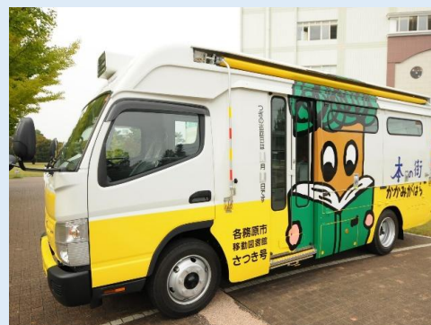
移動図書館 さつき号