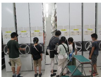
中央図書館 作年の様子